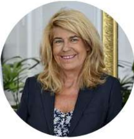
Dominique Faure , Ministre déléguée chargée des Collectivités territoriales et de la Ruralité